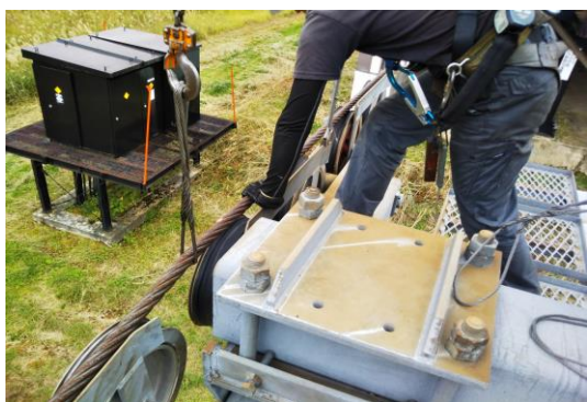
支柱索受けの点検整備