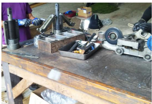
Cリフト 握索機分解整備