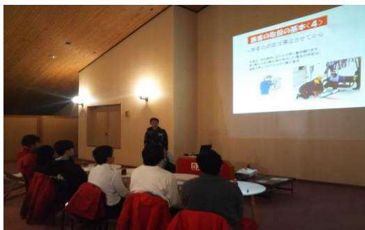
新人安全教育研修風景