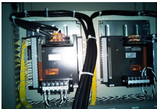
A・Dリフト シーケンサ更新