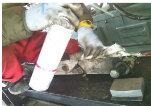
Bリフト 常用制動機分解整備